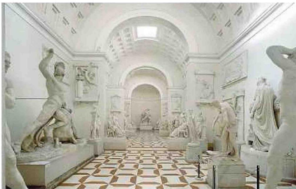
Capolavori La gipsoteca canoviana a Possagno, in provincia di Treviso